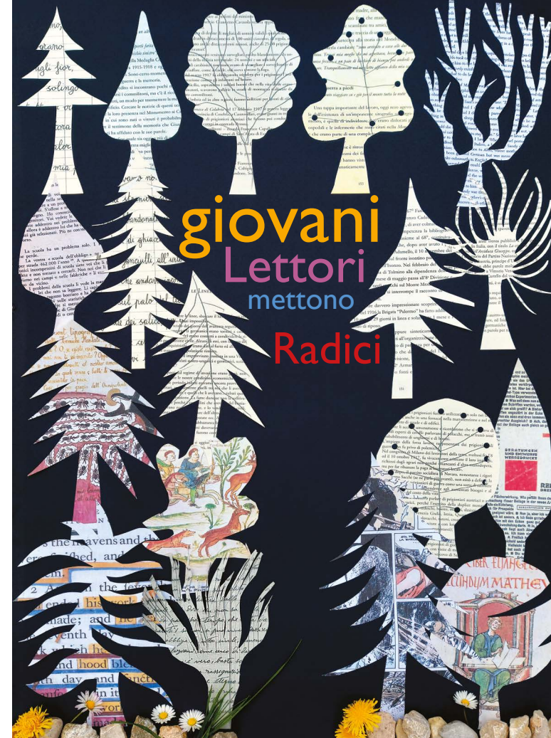
immagine: KELLERMANN - Stampato dalla Provincia di Treviso

I Bibanesi Da Re Spa, Il Treno di Bogotà Libreria per Ragazzi Libreria Il Viale