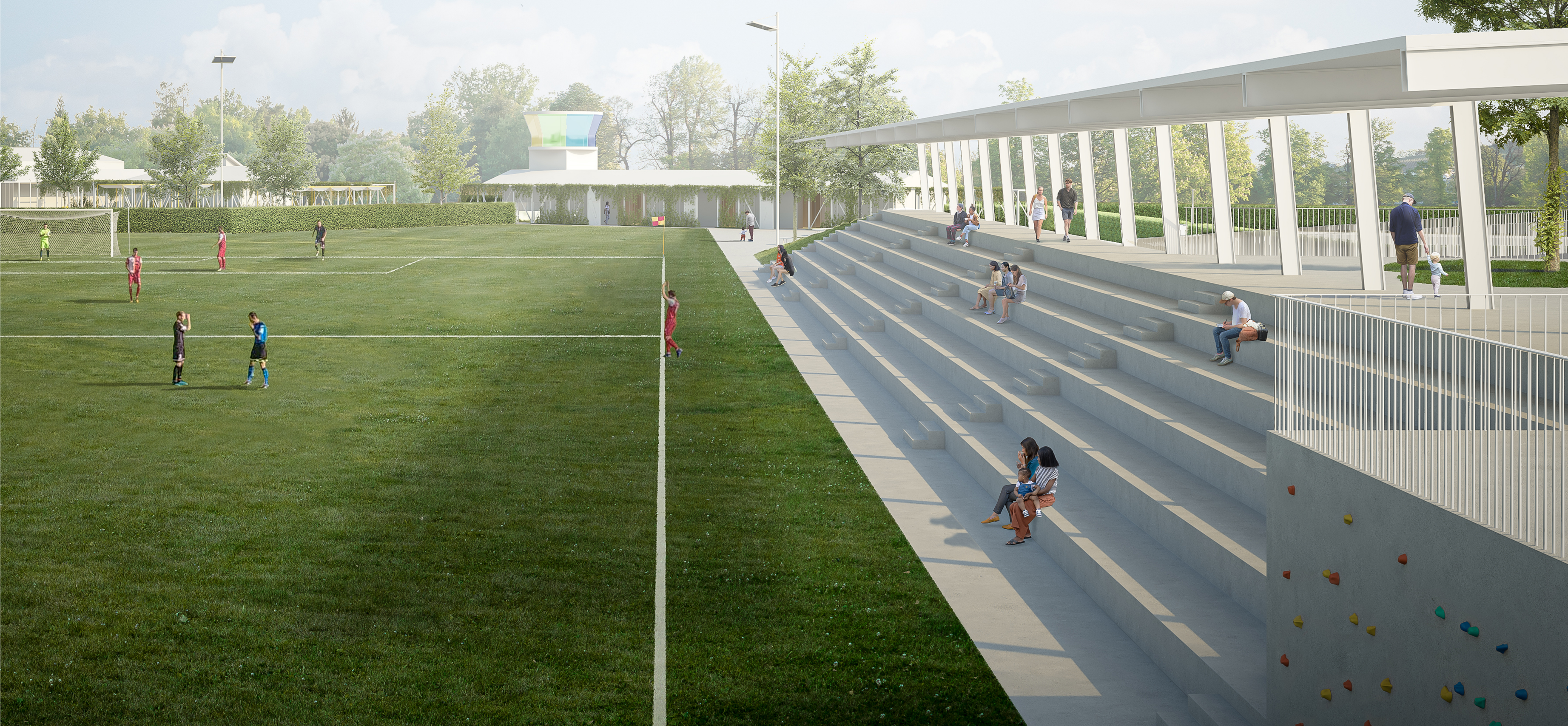
V1_Vista delle tribune e del campo da calcio con torre di controllo/centro visite sullo sfondo