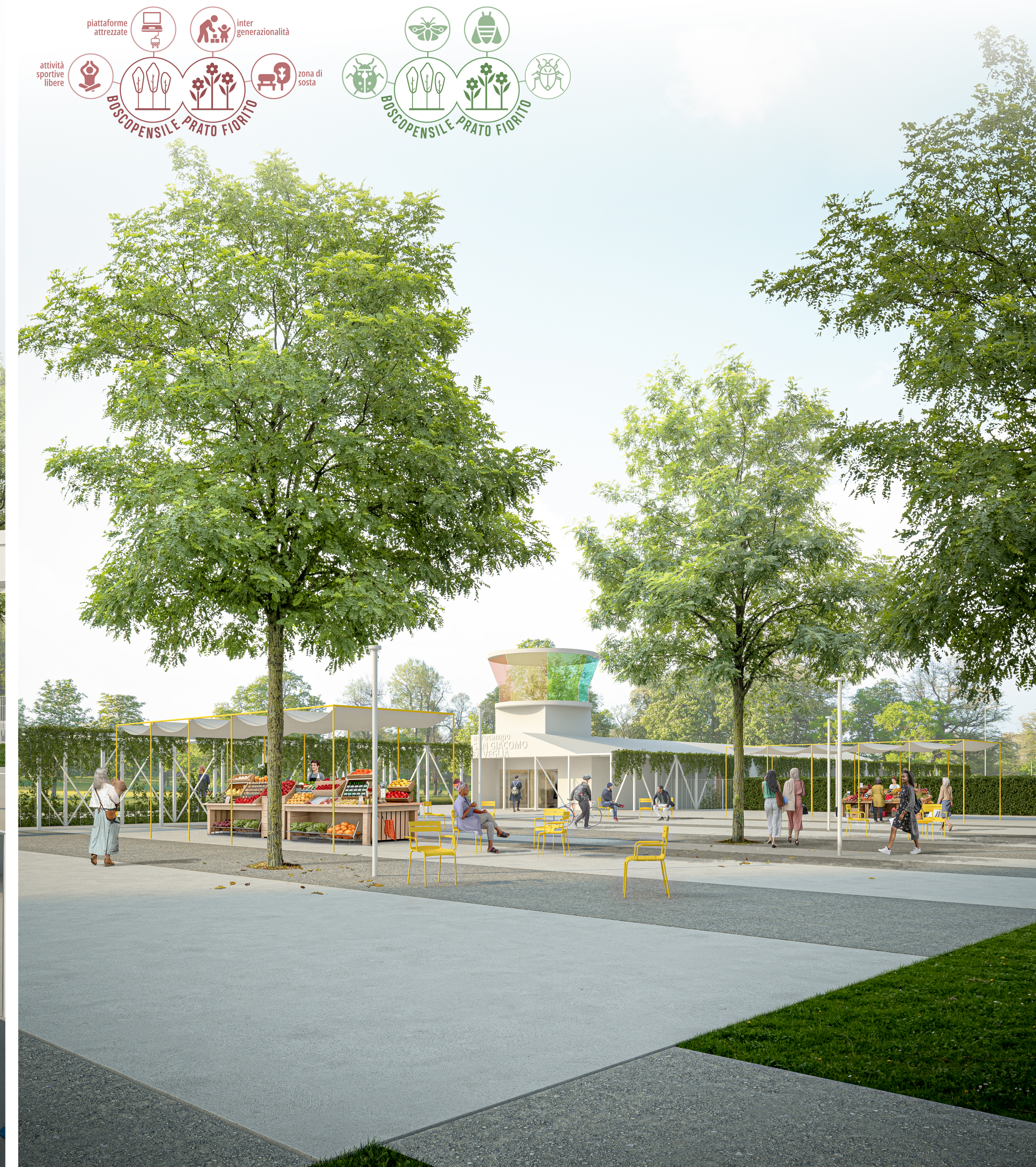
V2_Vista dell'area ingresso e dello spazio attrezzabile per eventi